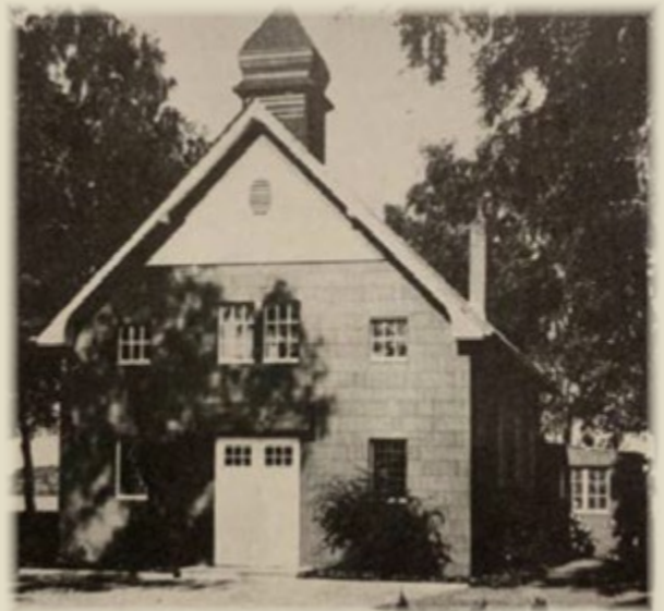
St.-Helena-Kapelle in den 1970er Jahren

1968 und 1973 wurde die Kapelle gründlich renoviert, bei der zweiten Renovierung wurde sie mit Platten versehen, um die hölzerne Außenfassade zu schützen. 1974 wurden die Kirchenbänke erstmals ausgetauscht. Auch das Mahnmal zu Ehren der Gefallenen der beiden Weltkriege wurde 1974 errichtet. Zudem wurde der Altarraum umgestaltet. 1984 wurden der Innenraum neu gestrichen und die Holzdecke angebracht.