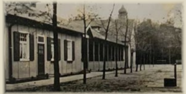
Walderholung um 1920