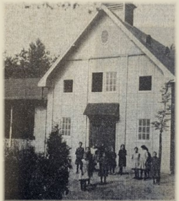
Ursprünglich stand die Kapelle direkt neben der Liegehalle der Walderholungsstätte