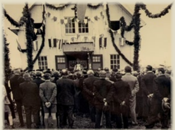
Die kleine Kapelle konnte nicht alle Besucher aufnehmen, so groß war der Andrang