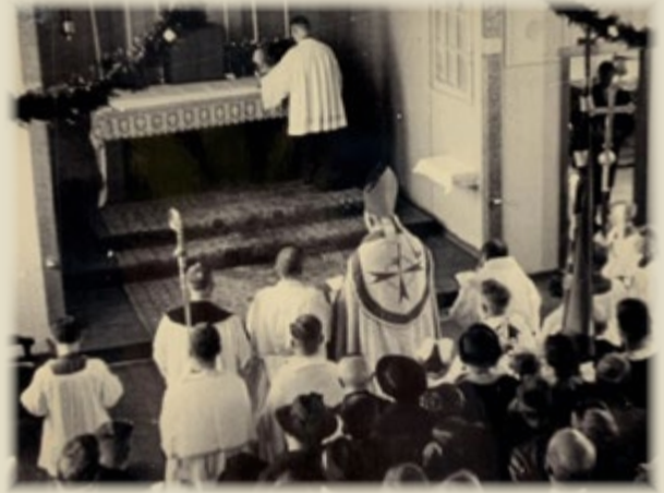
Gottesdienst zur Einsegnung der St. Helena Kapelle

Mit dem Wiederaufbau und Einsegnung der St. Helena Kapelle in Hemden hatte die Gemeinde nach 116 Jahren wieder ein eigenes Gotteshaus. Neben den Gottesdiensten wurde in der Kapelle der Religionsunterricht für alle schulpflichtigen Kinder abgehalten. Nach der damaligen Gottesdienstordnung war an den Sonn- und Feiertagen jeweils um 7 Uhr eine hl. Messe (meist mit Predigt) vorgesehen sowie nachmittags um 15 Uhr eine Andacht.