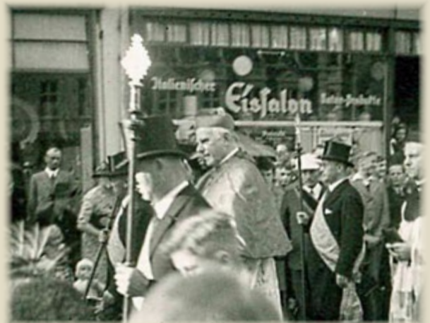
Clemens August Graf von Galen besucht auch Bocholt