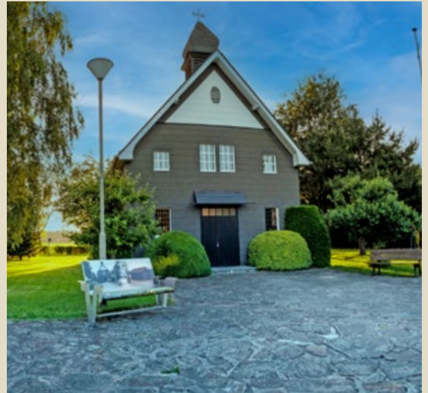
St. Helena Kapelle vor der Renovierung der Außenanlagen