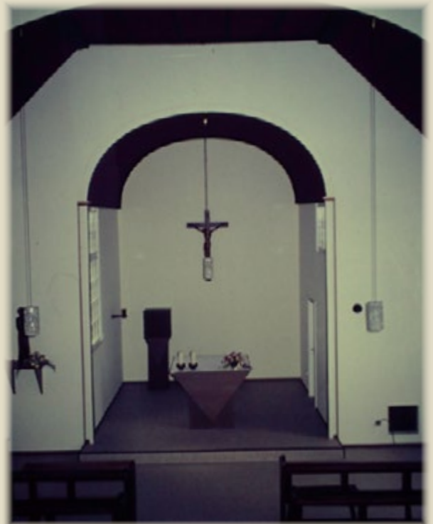
Altarraum der Kapelle nach der Renovierung