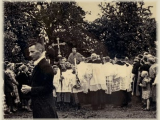
Der Bischof von Münster erreicht Hemden

D iese Kreuzkapelle hatte nicht nur für Hemden sondern grenzüberschreitende Bedeutung. Denn nach der Reformation im 16. Jahrhundert und besonders nach dem niederländischen Unabhängigkeitskrieg gegen Spanien (1568–1648) wurde die römisch-katholische Religion im Gebiet der späteren Republik der Niederlande verboten. Die Reformierte, Calvinistische Kirche wurde Staatskirche und katholische Gottesdienste waren öffentlich untersagt, Priester wurden teils verfolgt, Kirchengebäude beschlagnahmt. Katholiken konnten ihren Glauben nur heimlich in sogenannten „Schuilkerken“ (versteckten Kirchen) ausüben – meist unauffällige Gebäude, die nach außen wie Wohnhäuser aussahen. Fürstbischof Christoph Bernhard von Galen ließ 1674/ 75 die Hemdener Kreuzkapelle in seinem Kampf gegen den holländischen Calvinismus für die dortige katholische Bevölkerung „zum Troste der verlassenen Schafe“ erbauen, nur etwa 200 m von der niederländischen Grenze entfernt. Sie wurde genau wie die Aaltener Kirche, die den Protestanten anheim gefallen war, nach der heiligen Helena benannt. Häufig wurde sie von der niederländischen Bevölkerung besucht. In Hemden geht die Rede, dass die niederländischen Bauern und Landarbeiter im Arbeitszeug zur Kirche gingen, mit Sensen und Hacken, um nicht als Kirchgänger aufzufallen.