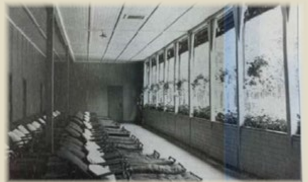
Liegesaal 1918, Tuberkulose-Therapie für „Bocholter Blagen“