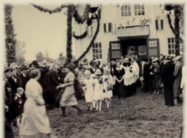
Auszug aus der Kapelle